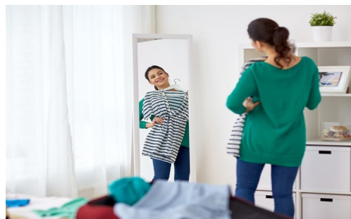
Lei (vestirsi) _____.