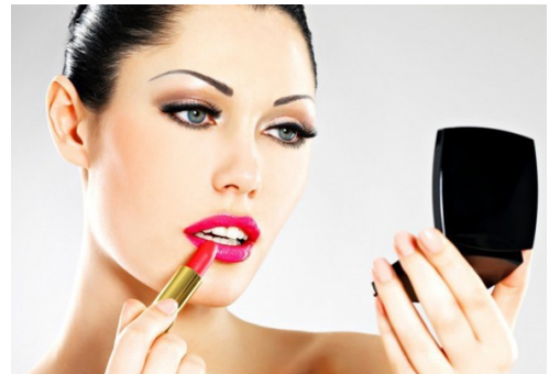
Lei (truccarsi) _____ con cura.