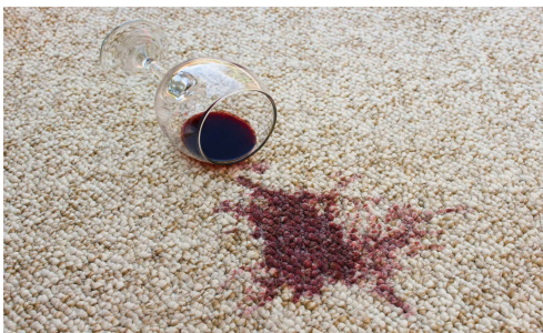
Loro (sporcare) _____ il tappeto.