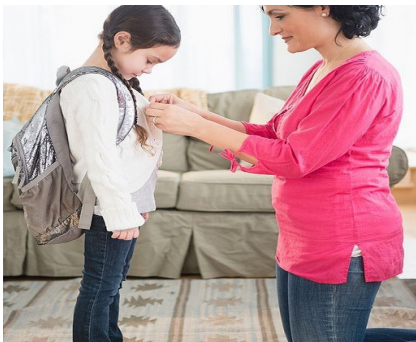
La mamma (vestire) _____ la figlia.