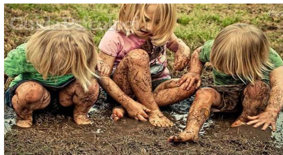
I bambini (sporcarsi) _____ in giardino.