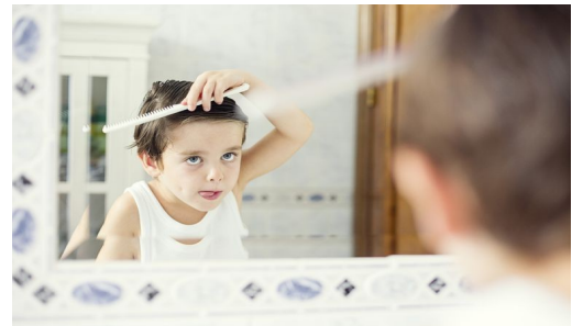
Lui (pettinarsi) _____.